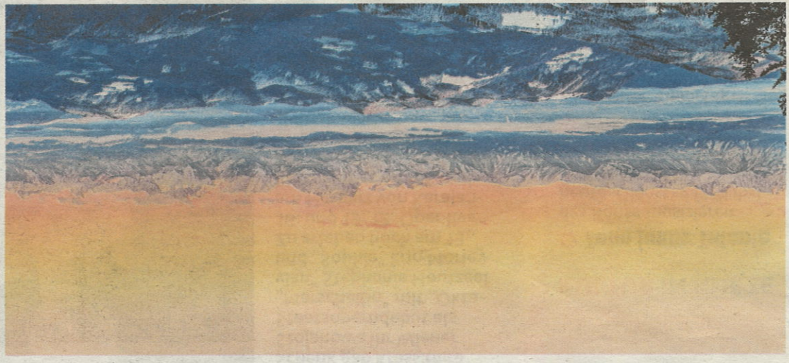
Der Ausblick vom Große Sauafen in 2000 Meter Seehöhe ist atemberaubend

Das Brauchtum im Bezirk St. Veit soll auf eine breite Basis gestellt werden. Deshalb hat Landesrat Christian Bengner bei einem Treffen mit Vertretern von zwölf Vereinen aus dem Bezirk dafür finanzielle Unterstützung des Landes zugesichert, und zwar insgesamt 22.000 Euro. „Vereine sind die Säulen unseres gesellschaftlichen Zusammenlebens in den Tälern und Gemeinden“, betonte Bengner.