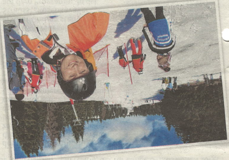
Der Hang eignet sich vor allem für junge Pistenföhle